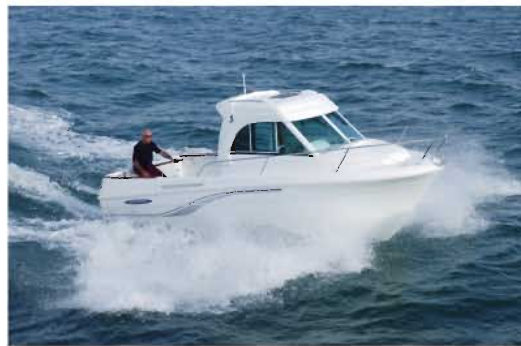
Antares 6 Fishing