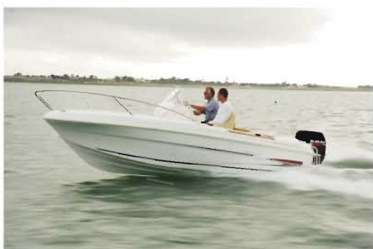
Flyer 550 Open