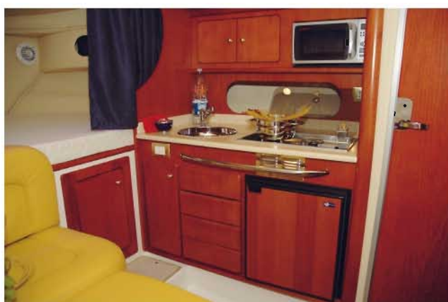
Cocina totalmente equipada