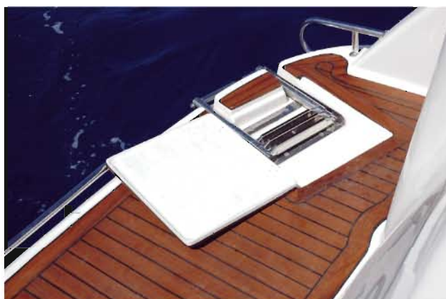
Escalera plegable y asideros en la plataforma

El cuadro de mando se caracteriza por tener líneas deportivas, dentro de la elegancia. Más a popa encontramos una estupenda dinete, convertible en solarium, compuesta por una mesa de dos patas y cuatro posavasos, y dos asientos enfrentados capaces de amenizar las comidas para hasta un total de seis. También encontramos en la bañera, concretamente a babor, una encimera que al abrir, encontramos un grifo. En este mismo mueble, opcionalmente podemos instalar un frigorífico, para aumentar las comodidades a en cubierta.