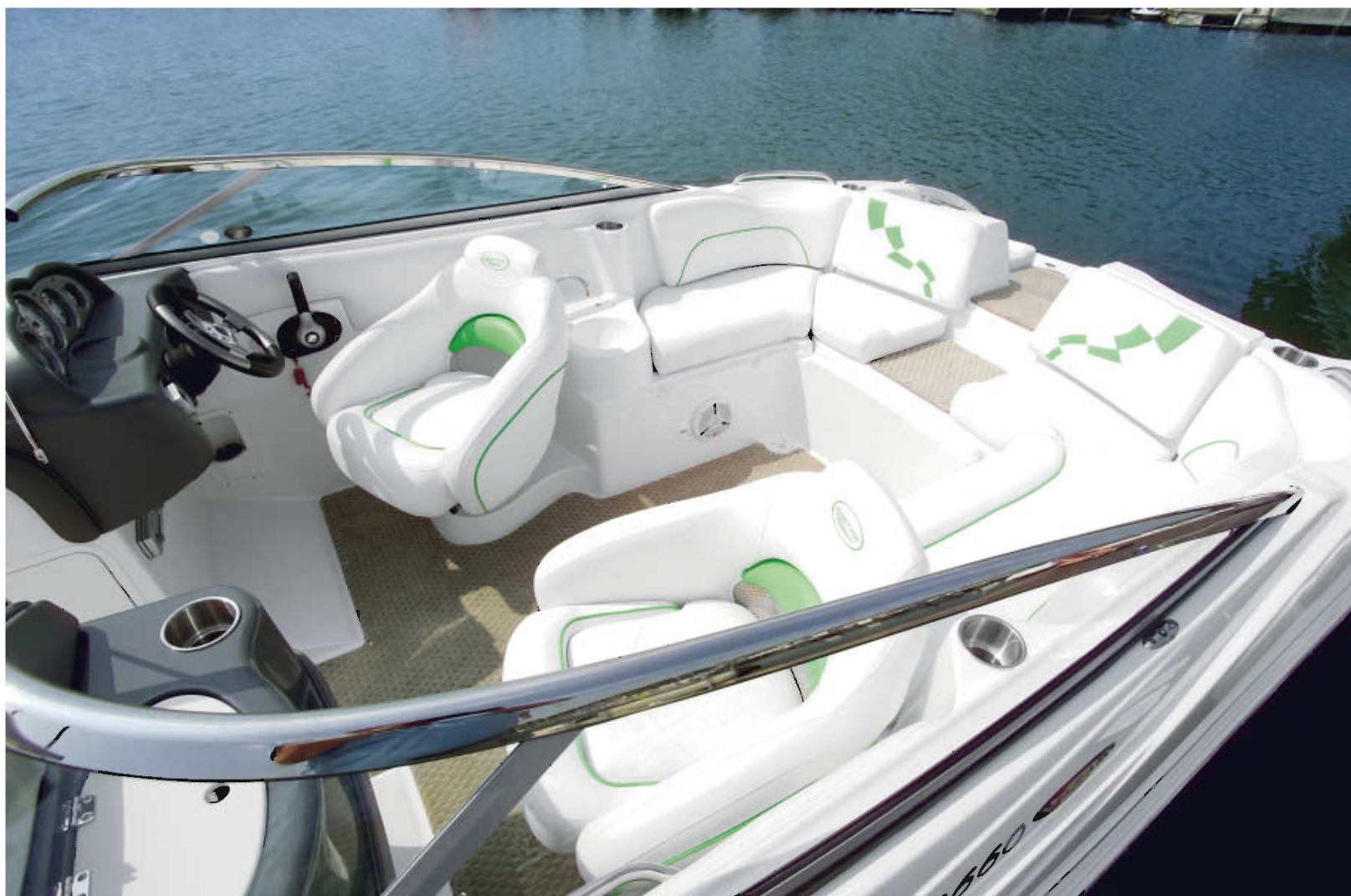
El parabrisas en acero inox es otra muestra de los altos acabados de los que goza Ebbtide