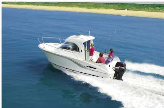
Antares 650 HB