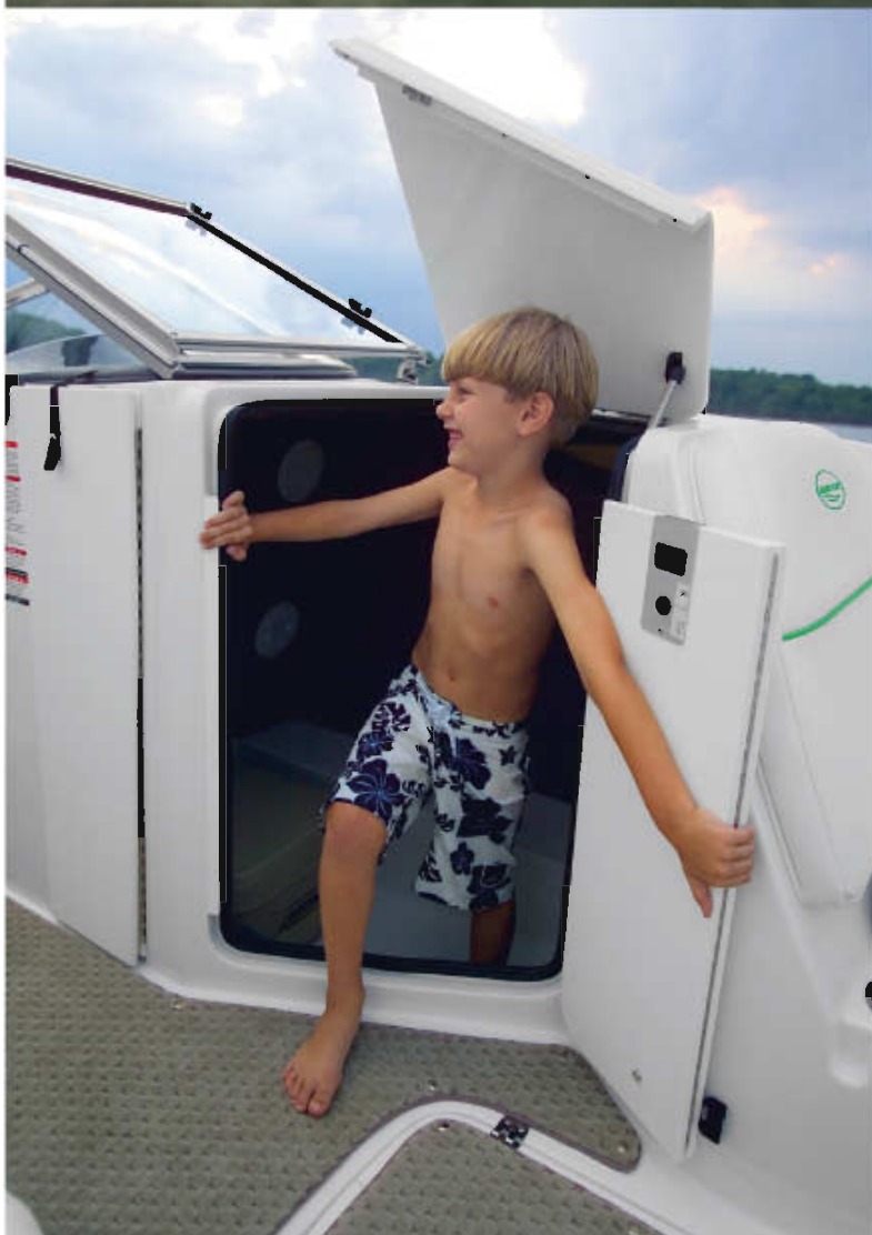
Camarote cambiador, con inodoro químico

"Es una embarcación perfecta para pasar el día en familia o con amigos, o por que no, todos juntos, dado que admite hasta 12 personas a bordo"