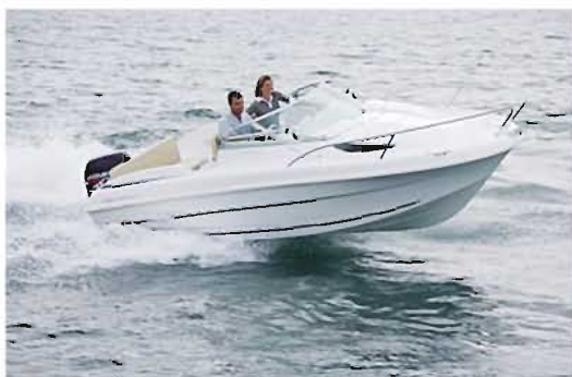
Flyer 550 Cabin