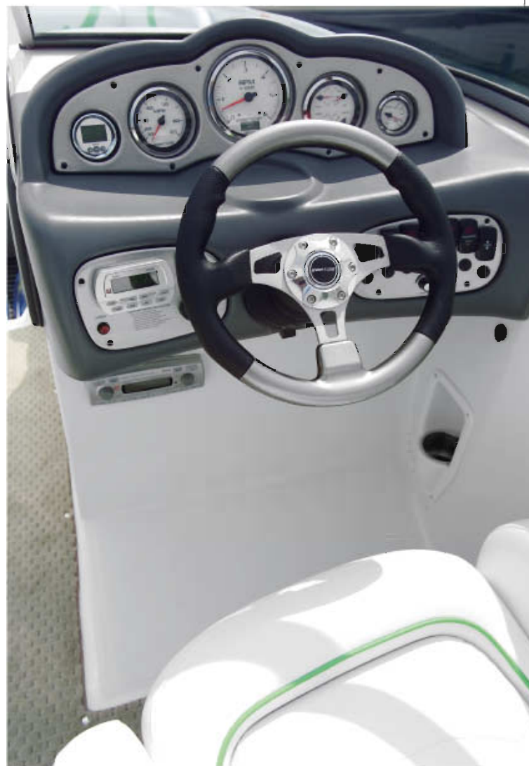
La deportividad se aprecia en cada rincón del barco

Todo este confort y habitabilidad será movido a través de una novedosa carena deportiva, con su patentado sistema z-track, y con potencias de hasta 420 cv para los amantes de la velocidad y los deportes náuticos.