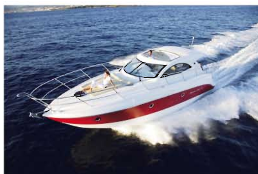
Montecarlo 37 Hard Top